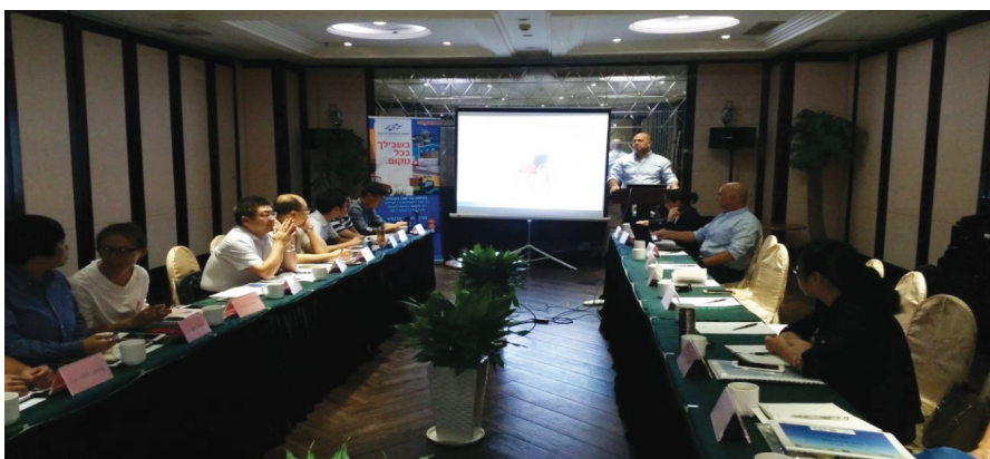
הסינים לומדים בטיחות בענף הבנייה

כמתחייב בחוק. מרשמים שהגיעו מסין, עולה כי ההדרכות בוצעו בהצלחה רבה תוך שיתוף פעולה מלא מצד כל המשתתפים. ■