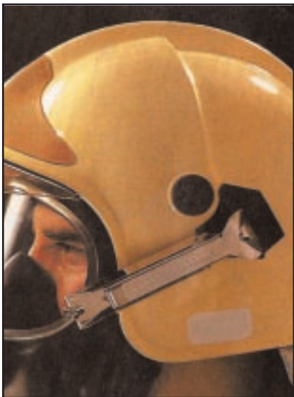
קסדה עם מגן פנים