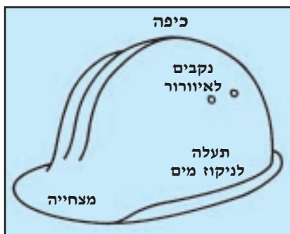
הרכיבים החיצוניים של כיפת הקסדה המשפיעים על נוחות החבישה

לתנאים האקלימיים בתוך הקסדה יש השפעה רבה על נוחות חבישתה (ראו איור