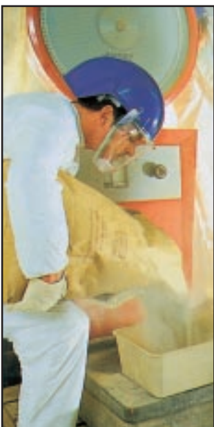
קסדות משולבות עם מגן פנים ו/או עם מסיכת נשימה