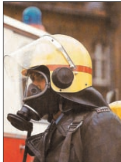
קסדה עם מסיכה

שימוש בקסדות המשולבות באביזרי מגן נוספים אינו תמיד נוח, אך כאשר התנאים מחייבים - יש להשתמש בהן. קסדה כזאת אמורה לשמש אך ורק למשימה עבודה נועדה.