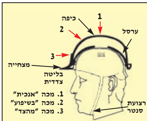
קסדת המגן כבולם מכות מכיוונים שונים

כיפת קסדת המגן חייבת להיות עמידה כנגד התבקעות, אשר עלולה להיגרם על ידי עצמים הפוגעים בה, וכנגד חדירתם דרכה. צורתה המיוחדת של הכיפה נועדה לגרום לכך שרק חלק מהאנרגיה הקינטית של העצמים הפוגעים בה תגיע לראש, וזאת שתגיע תתפזר שם, ולא תתרכז על שטח מצומצם. מבנה הקסדה יכול, במקרים רבים, לאפשר לגוף הפוגע להמשיך במעופו לאחר פגיעה בראש העובד (תוך שינוי כיוון) ולשאת איתו חלק מהאנרגיה הקינטית.