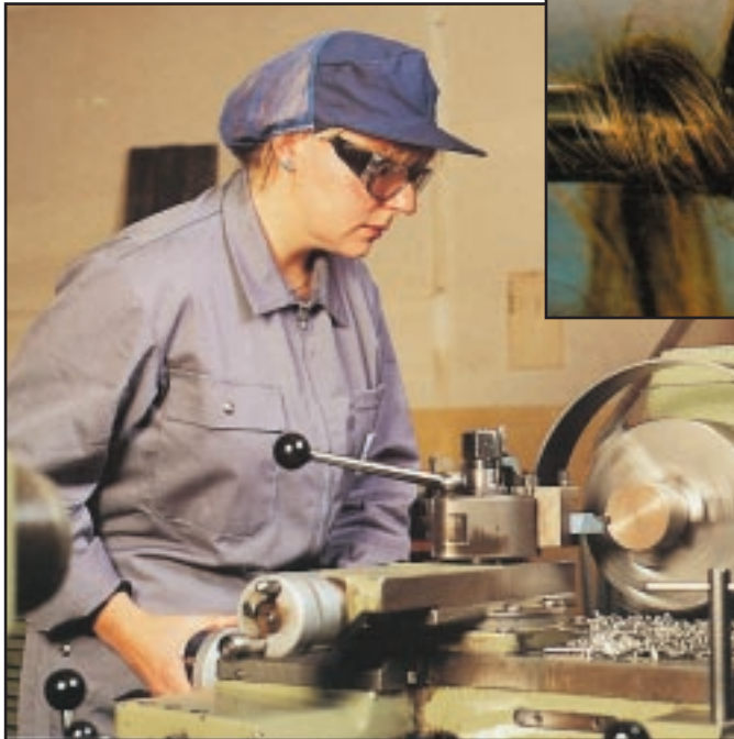
שיער שנכרך על ציר מסתובב