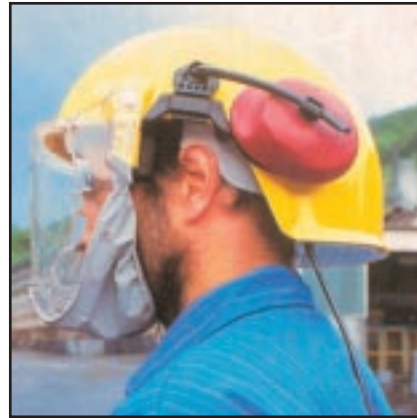
קסדה עם אוזניות