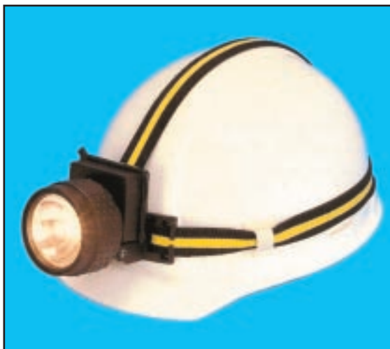
קסדה עם פנס אישי