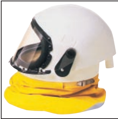
קסדה משולבת עם ברוס להגנת הנשימה ומגן פנים