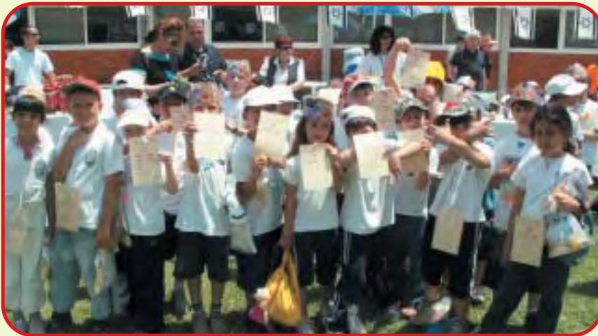
תלמידי כיתה א' - נאמני בטיחות בבית הספר

למען הגברת המודעות לבטיחות בקהילה בכלל, וליצירת אקלים בטיחות ארגוני במרכז הרפואי 'ברזילי' באשקלון, החליטה הנהלת המרכז לארגן "הפנינג בטיחות". האירוע התקיים בחודש מאי ונמשך 3 ימים (7.5-9.5). בהתרחשויות השתתפו מאות מתושבי אשקלון והסביבה וכמובן - עובדי המרכז הרפואי.