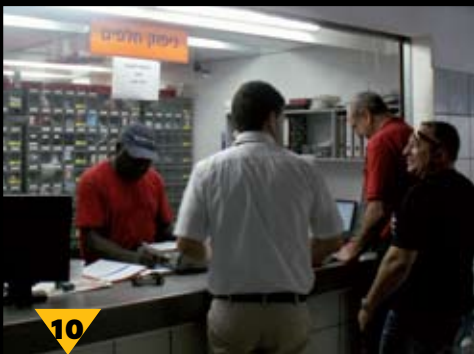
10 השירות לעובדים נעשה מעבר לדלפק מרווח ומואר היטב