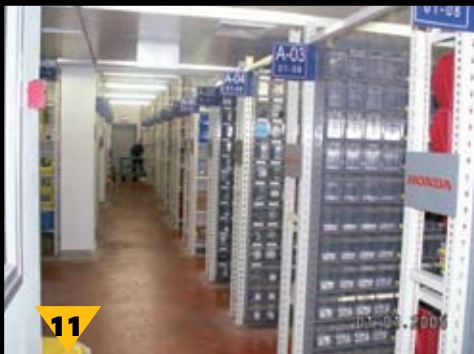
11 המחסן מסודר עפ"י איתור ממוחשב, עם מדפים ממוספרים