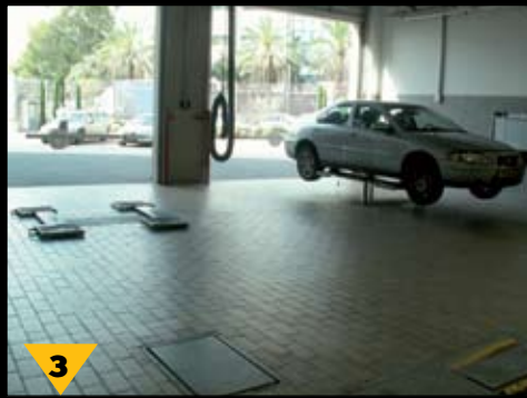
3 מיתקני ההרמה (ליפטס) שטוחים ומשוקעים ברצפה באופן שאינם מהווים מכשול כאשר אינם בשימוש