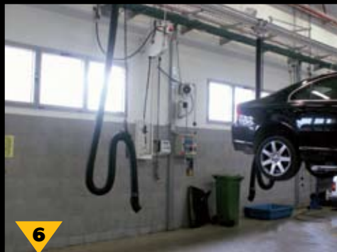
6 מיתקני שאיבה להרכבה על המפלט (אגוז) למניעת פליטת גזי שריפה מפעולת מנוע הרכב שבטיפול