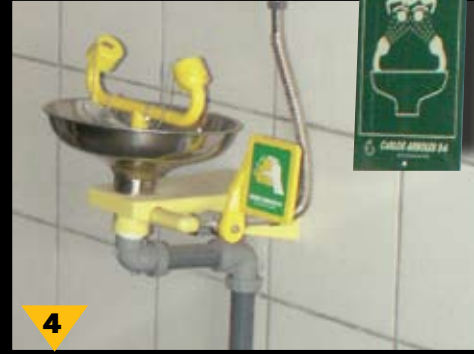
4 בקירבת העובדים מצויים מיתקני שטיפה למקרי חירום של התזת חומרים