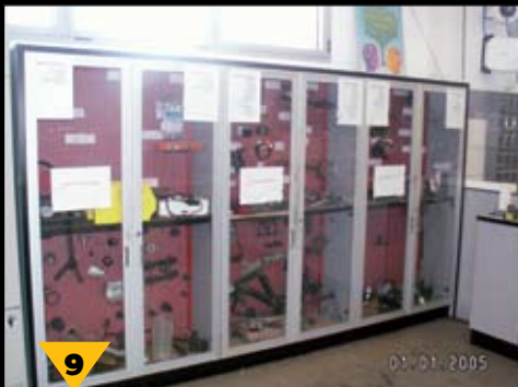
9 ריכוז כלים מחלקתי בארון עם דלתות שקופות