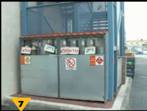
7 אזור אחסון גלילי גזים