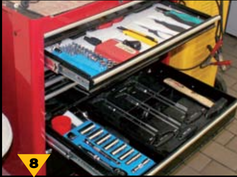
8 ריכוז כלי עבודה אישיים בארונות על גלגלים