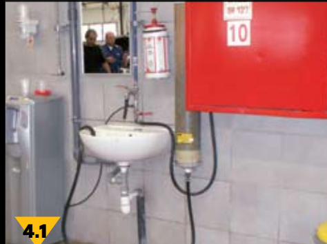
4.1 לאורך קירות האולם מותקנים כוורים לשטיפת ידיים