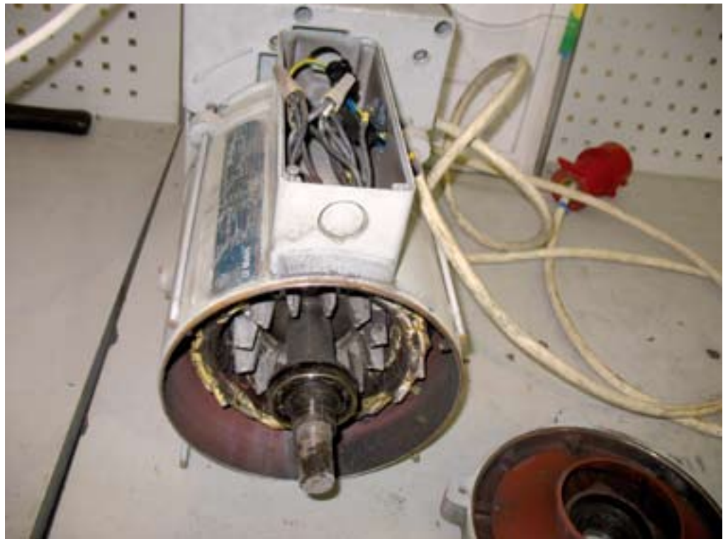
איור 2: דוגמה למנוע חשמלי תעשייתי (משאבת ואקום) עם חיבורי חשמל (מכסה הגנה הוסר)

יש להקפיד על חיבור הארקה המנוע, התקנת גלגל הרצועה, ומתיחה נאותה של הרצועה. יש לבדוק את התנגדות הבידוד החשמלי (של ליפוף המנוע) ורמתו. אם הבדיקה מצביעה על ערכים נמוכים יש לבצע אחת מהפעולות הבאות: חיבור הליפוף