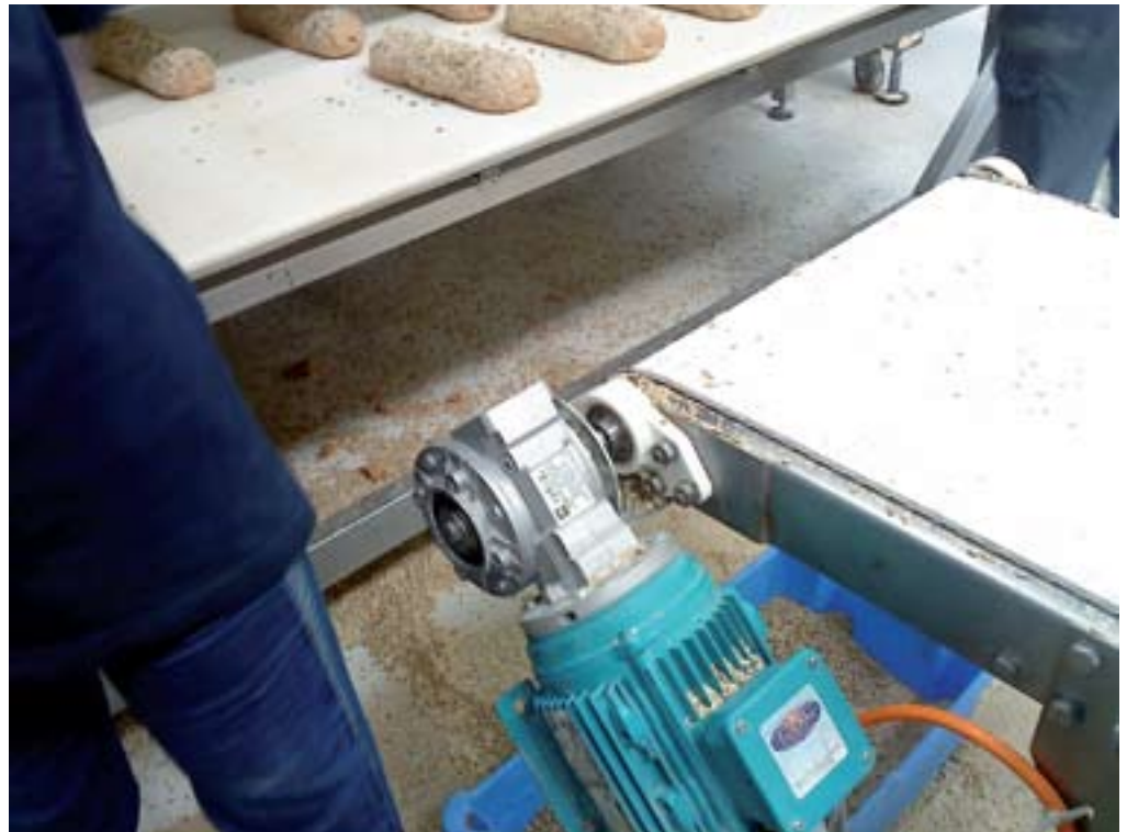
איור 3: מנוע המופעל בסביבת אבק קמח (חומר נפיץ).

● בדיקות מכניות: ניטור רעידות בתדר היסודי (50 Hz) ובהרמוניות