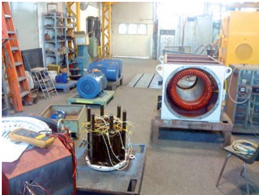
איור 4: בדיקות נתוני המנוע במפעל לייצור ותיקון מנועים

למתח מונמך ב-10%, או אימפרגנציה (הספגה) וייבוש הליפוף בתנור.