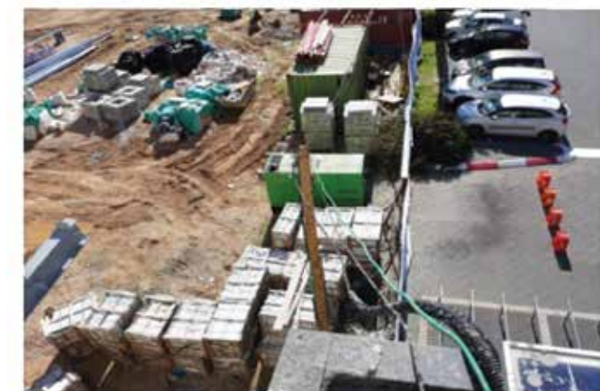
תיאור מפגע מתוך אתר "קו החיים"

בעבר, כשארגון פתח "קו חם" לצורכי דיווח כלשהו, מכשיר הטלפון עבד שעות נוספות. כיום, את קו הטלפון מחליפה רשת האינטרנט שדרכה אפשר לשלוח דיווח בעזרת כל מכשיר המחובר לרשת. יתרה מכך, בעולם הרשתות חברתיות והשיתופיים, אפליקציות כגון ויזו, מובייק ודומותיהן השכילו להפיק מידע חיוני משיתוף הגולשים כדי לקדם ולתחזק את פעילותן. על בסיס מידע שיתופי זה בנו אותן חברות מערכות רחבות מאוד לאספקת מידע עדכני ולתפעול אופרציות "און ליין". המוסד לבטיחות ולגיהות, שחרת על דגלו בשנה האחרונה הובלת תהליכים הנתמכים בקדמת הטכנולוגיה, החליט גם הוא לקדם את תרבות הבטיחות והבריאות התעסוקתית באמצעות רשת האינטרנט. מיזם "קו החיים" של המוסד לבטיחות ולגיהות, שהושק לאחרונה, המאפשר לכל אזרח לדווח "מהשטח" על מפגע מסכן חיים באתרי בנייה, הציב בפני מחלקת הטכנולוגיה מטרה ברורה - להנגיש לכל אזרח את האפשרות הדיגיטלית לדווח online על מפגע בטיחותי היישר מאתרי הבנייה.