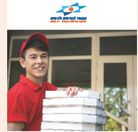
חוק ותקנת עובדת נוער