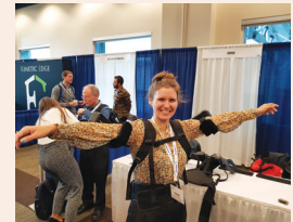
ארגונומיה בסייטל עמ' 7