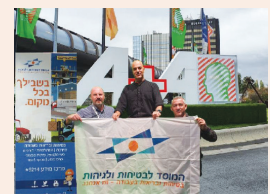
קפצנו לתערוכת הבטיחות בגרמניה עמ' 16