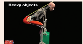
ארגונומיה בחיי היום-יום עמ' 12