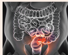
גורמים תעסוקתיים למחלות מעיים עמ' 30