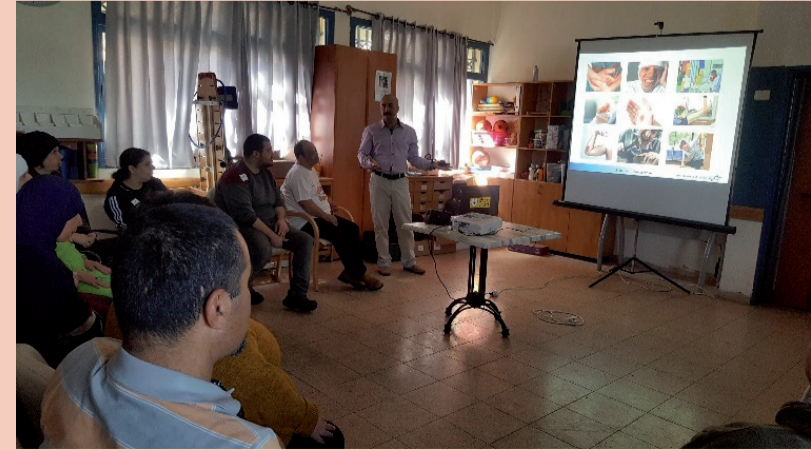
הרצאה בכפר במשולש

שילוב חניכים בעלי צרכים מיוחדים במערך העבודה הוא אפשרי ואף מתבצע. חלקם משתלבים במסגרת התעסוקה שאליה הם מיועדים, ומפיקים ממנה תועלת רבה, הן מהבחינה החברתית והן בהגשמה עצמית. שילוב חניכים בעלי צרכים מיוחדים במרכזי תעסוקה מדגיש את זכותם לחיות חיים רגילים. במפגשי הדרכות הבטיחות שהעברנו לחניכים מן החברה הערבית, במסגרת הפרויקט שקידם ויזם המוסד לבטיחות ולגיהות במרכזי תעסוקה לבעלי צרכים מיוחדים, הורגש השינוי בתפיסת החניכים לאחר שעברו את הסדנה בת ששת המפגשים בנושא הבטיחות בעבודה ולמדו כיצד לשמור על עצמם ועל חבריהם לעבודה, ולהיות בסביבה בטוחה במרכז התעסוקה, בבית ובכל מקום אחר. הפרויקט התקיים במרכזי תעסוקה, ששיתפו פעולה ביוזמתם עם המוסד לבטיחות ולגיהות והסכימו להיחשף. על אף הקושי בעבודה היום-יומית, הם היו נחוצים לקדם את הנושא ולבחור קבוצה של חניכים פעילים ושותפים להדרכה. החומר שהועבר בסדנה הותאם על ידי המחשבות פיזיות, כגון הצגת ככל חשמל חשוף והסבר על סכנת ההתחשמלות הנשקפת ממנו; איך להחזיק נכון סכין יפנית או מספרים; לשים לב לחוטים וניילונים שפזורים על רצפת אולם הארזיה, ולמה שקורה אם נתקלים בהם, ועוד. בסוף המפגש, יצאו החניכים עם