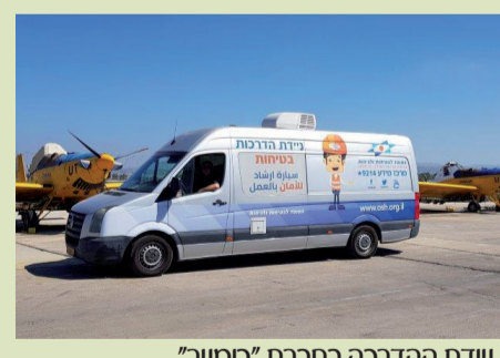
ניידת ההדרכה בחברת "כימנור"