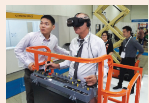
משקפיים חכמים, שנותנים הוראות הרכבה עמ' 22