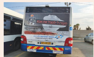
קמפיין שחצה קהלים ומגורים עמ' 5