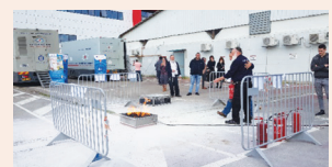
יום בטיחות אש חוויית במחוז מרכז עמ' 10