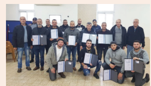
עוזרי בטיחות בבנייה בצפון עמ' 6