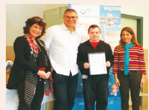
הכשרת בטיחות לעובדים עם מוגבלות עמ' 12