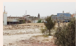
הנחיות למנהלי מפעלים בדרום עמ' 8