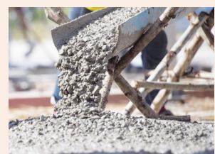
הפחתת החשיפה למלט עמ' 22