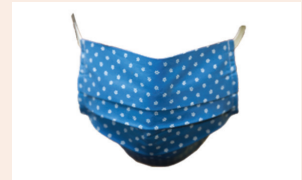
לא למסכות בד! עמ' 5