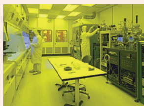
עוטים מסכות גם בחדרים נקיים עמ' 28