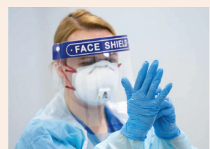
לא תמיד הציוד מותאם לנשים עמ' 10