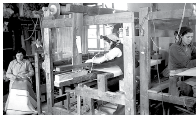
נשים עובדות במפעל טווייה

המוסד לבטיחות ולגיהות החליט השנה להרחיב את הפעילות ההסברתית וההדרכתית גם למגזרים הללו, בדגש על הנשים העובדות אשר לא נחשפו עדיין להוראות החוק ולדרכים להגנה על בריאותן ובטיחותן במקום העבודה. ■