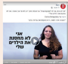
חוסר אמון ברשויות, לא חוסר ידע עמ' 13