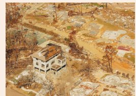
ICF - שיטת בנייה שעמידה בפני מזג אוויר עמ' 14