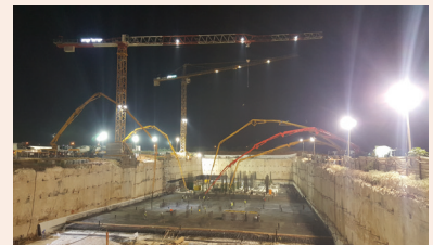
היבטי בטיחות בשינוע בטון עמ' 22