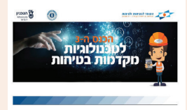
מסורת שיתוף הפעולה נמשכת עמ' 6