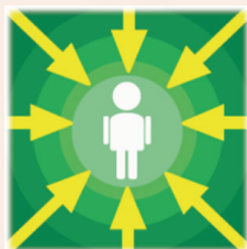
ארגונומיה - התאמת סביבת העבודה לעובד עמ' 28