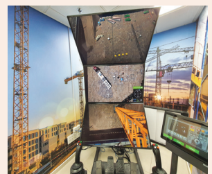
למידה בסביבה בטוחה עמ' 7