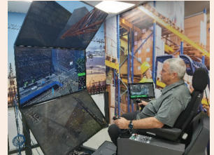
המרכז הלאומי לאימוני בטיחות עמ' 5