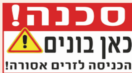
שילוט התרעה באתר בנייה עמ' 26