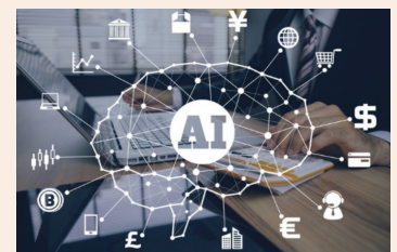
בינה מלאכותית - אופקים חדשים בבטיחות עמ' 23