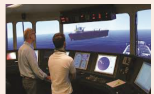
יתרון הסימולטור על ההדרכה הפורונטלית עמ' 9