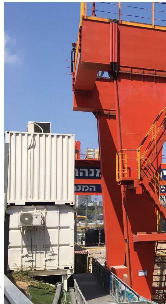
אילוג: שרון מחט

"מספר ההרוגים בענף הבנייה גבוה מכדי להתייחס לזה כאל טעות אנוש חד-פעמית. זו תופעה שעולה בחיי אדם וכיוון שערך חיי אדם באשר הוא, ללא הבדל גזע, מין, דת או לאום, גבוה, אנחנו מחויבים לו"