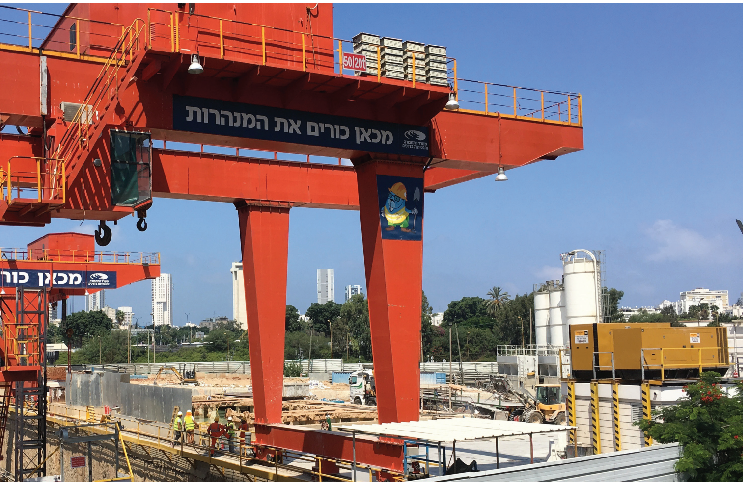
תנופת בנייה, התחדשות עירוניים וריבוי פרויקטים בתל אביב