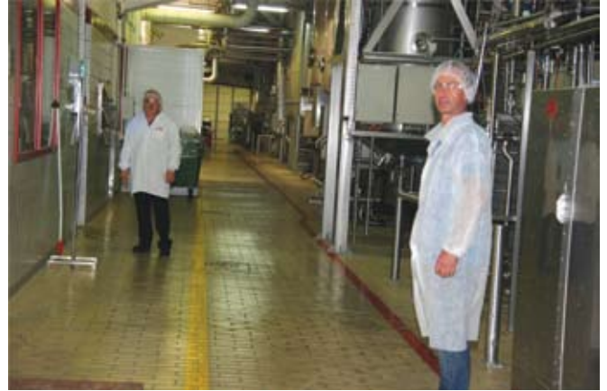
תנועת כלים - בין הקו הצהוב לאדום. תנועת אנשים - עד הקו הצהוב

בפני המנהלים את התנהלות העובדים וכן לשקף למנהלים עצמם את יחסם לבטיחות, להשוות בין תצפיות העובדים לתצפיות המנהלים ולבחון את רמת ההתאמה בין התצפיות ואת הדגשים בתצפיות. אם, למשל, המנהל לא מתייחס בתצפית שלו לעובדים שאמורים להשתמש בצידוד מגן אישי נגד רעש, העובד יבין שנושא השימוש בצידוד מגן אישי נגד רעש הוא המלצה בלבד.