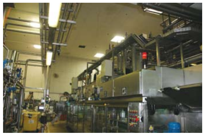
באולמות הייצור הותקנה תקרה אקוסטית, שסופגת חלק מועצמת הרעש