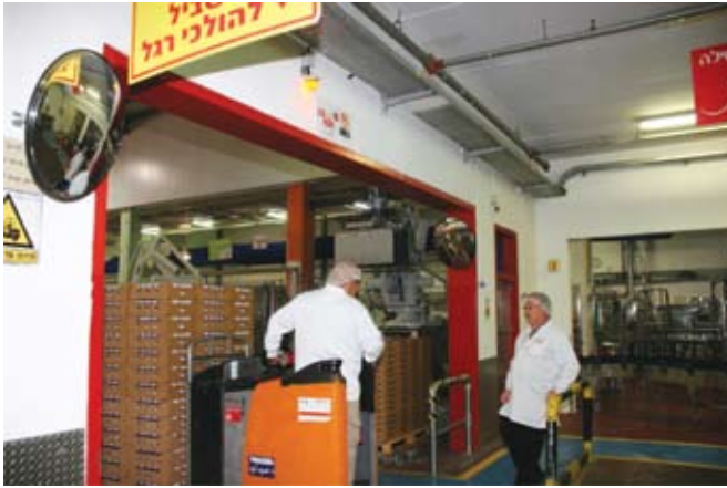
העובדים מתבקשים לנוע בשבילים המסומנים, כדי לא להיפגע מתנועת המלגזות. קיימת גם התרעה קולית