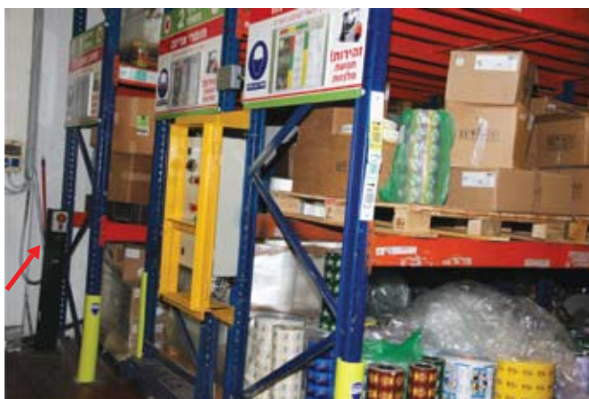
מערכת אופטית המתריעה על מעבר אדם ועוצרת את תנועת המדפים הנעים על גבי המסילה