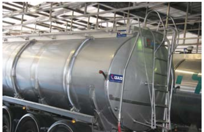
המכליות מגיעות לעמדת הפריקה. בעזרת הסולם הקבוע העובד, שקיבל הדרכה, מטפס. לאורך גב המכלית יש מעקה בטיחות