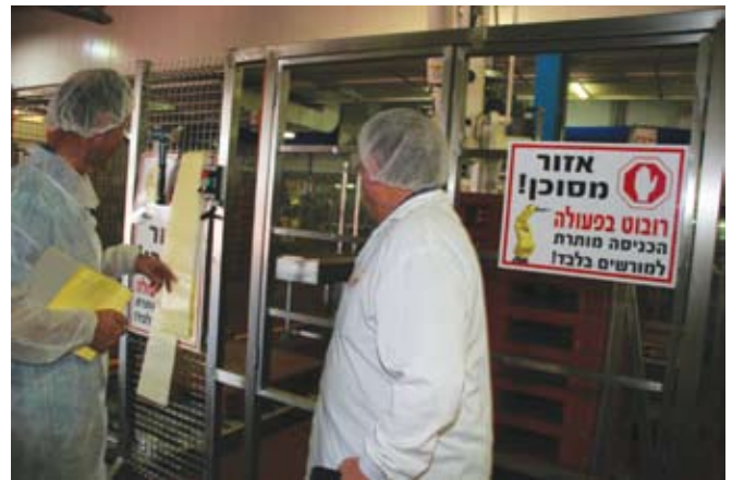
הרובוטים עושים עבודות ליקוט וחוסכים כאבי גב לעובדים. הכניסה למתחם פעילותם אסורה