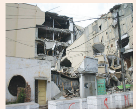
תקנים יפחיתו הריס מבנים עמ' 9