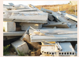
תרגול לחילוץ לכודים עמ' 5