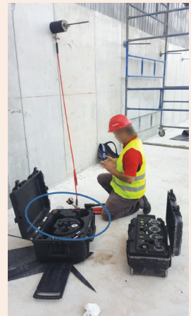
שליחותו של הממונה על הבטיחות בבנייה עמ' 22