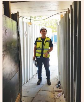
תמ"א ובטיחות הציבור עמ' 12