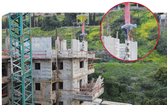
צולם באתר בנייה בחיפה

מנהל מחוז הצפון, המוסד לבטיחות ולגיהות