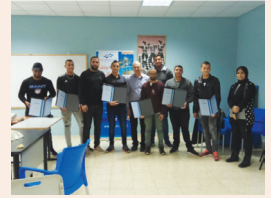
מחוז הצפון - קורס שגרירי בטיחות במגזר הערבי עמ' 5