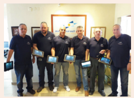
במסופון מפיקים דוח אבחון בטיחות מידי עמ' 10