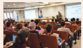
מחוז המרכז - קורסים יזומים לממוני בטיחות עמ' 6