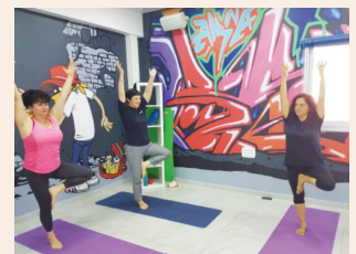
בכרמיאל משלבים ספורט בעבודה עמ' 21