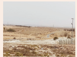
מחוז הדרום - משקי עוטף עזה לצד חוות הבדואים עמ' 8