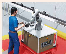
הרובוט הוא חברו (לעבודה) של האדם עמ' 24