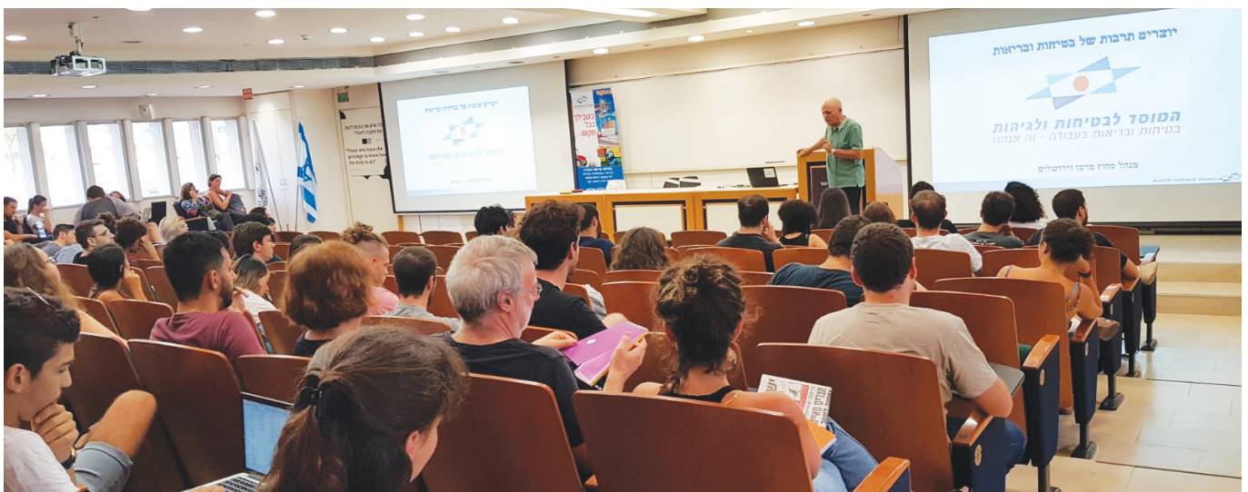
הדרכת בטיחות באוניברסיטת תל אביב

מיקוד מיוחד ניתן לענף הבנייה, על ידי מסירת פנקס כללי לאלפי