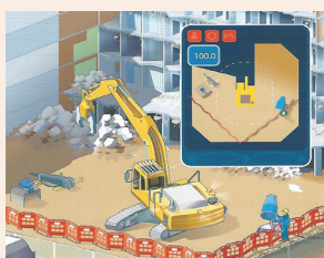
תאונה עם עגורן עמ' 31