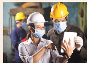
מאגר מידע דיגיטלי נייד עמ' 5