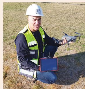
הרחפן - בטיחות ממבט-על עמ' 11