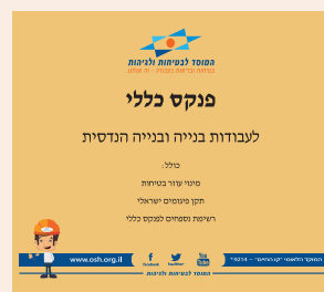
עדכון הפנקס הכללי לעבודות בנייה עמ' 10