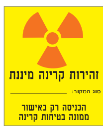
זהירות קרינה מייננת

סוג המקור: הכניסה רק באישור ממונה בטיחות קרינה