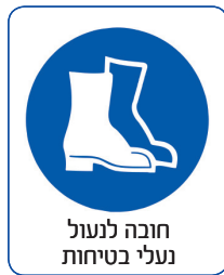
חובה לנעול נעלי בטיחות