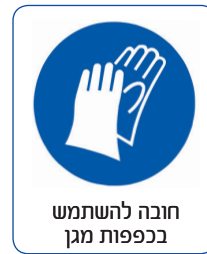
חובה להשתמש בכפפות מגן