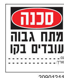
סכנה מתח גבוה עובדים בקו