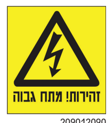
זהירות! מתח גבוה