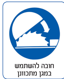
חובה להשתמש במגן מתכוונן