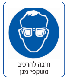
חובה להרכיב משקפי מגן