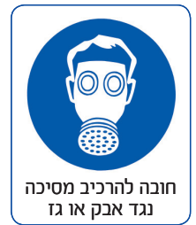
חובה להרכיב מסכה נגד אבק או גז