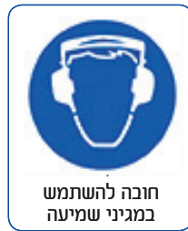
חובה להשתמש במגיני שמיעה