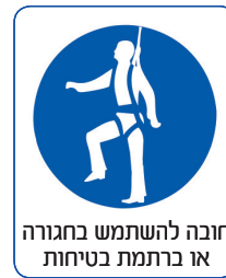
חובה להשתמש בחגורה או ברמת בטיחות