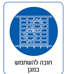
חובה להשתמש במגן