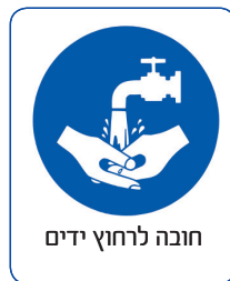
חובה לרחוץ ידיים