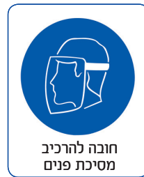
חובה להרכיב מסכת פנים