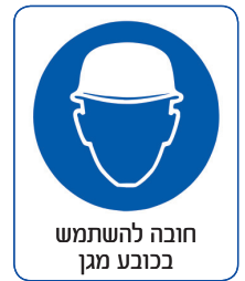
חובה להשתמש בכובע מגן