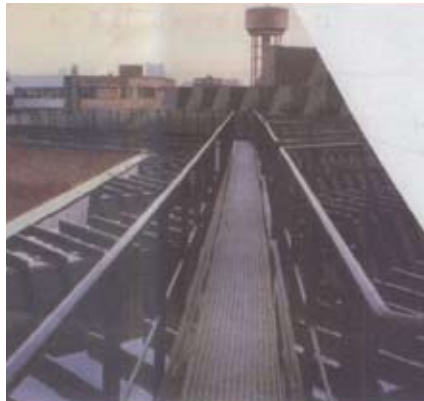
משטח הליכה קבוע עם גידורים מעל גג שביר

תקנה 8 אומרת שעבודה על גג תבוצע רק בידי עובדים מקצועיים לעבודה על גגות ותבצע בהתחשב בסיכונים האפשריים, תוך נקיטת אמצעים לפי הצורך. בפרק הגדרות מוסבר מי הוא עובד מקצועי: מי שלאחר הגיעו לגג 18 עבד שנה אחת לפחות בעבודות על גג שביר לאחר שהודרך בעבודה זו והוא בעל ידע מספיק בסיכונים ובאמצעי הבטיחות הנדרשים