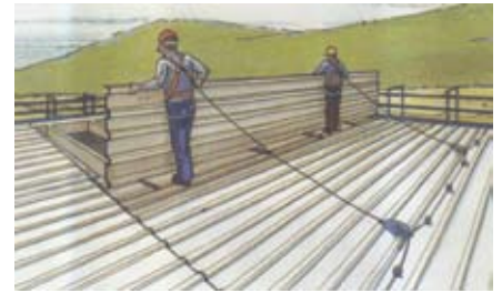
שימוש בצמ"א בשילוב עם בולם נפילה נסוג

פתרונות לא חסרים, אבל קודם כל, יש לאכזר ולשנן: לעולם אין לדרוך ישירות על גג או על קטעי גג עשויים חומר שביר. להלן כמה פתרונות פשוטים: כיסוי הקטע השביר שבגג על ידי מסגרת שקופה, שבתוכה נמצאים מוטות ברזל בקוטר 5 מ"מ לשני הכיוונים. כמו כן, ניתן לכסות את הקטע השביר