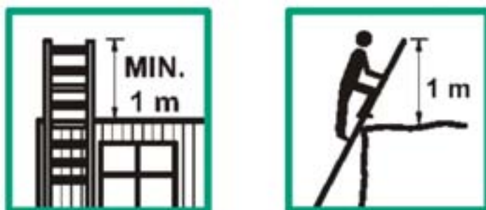
איור מס' 22 - גובה מינימלי של 1 מ' למעבר למשטח

20. ציוד הנישא בעת השימוש בסולם צריך להיות בעל משקל מועט וקל/נוח לנשיאה.