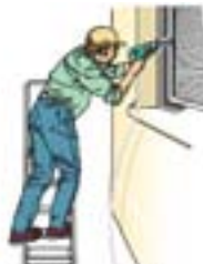
איור מס' 11 עבודה לא נכונה - עבודה צידית