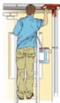
איור מס' 14 עבודה נכונה - אחיזה ב-3 נקודות