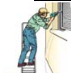
איור מס' 11 עבודה לא נכונה - עבודה צידית

22. יש להשתמש במאחז יד בעת עבודה מהסולם, או לחילופין יש להשתמש באמצעי עזר בטיחותיים אחרים.