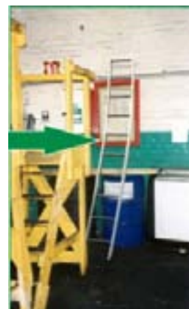
איור מס' 4