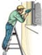
איור מס' 12 עבודה נכונה - עם הפנים והגוף לכיוון העבודה