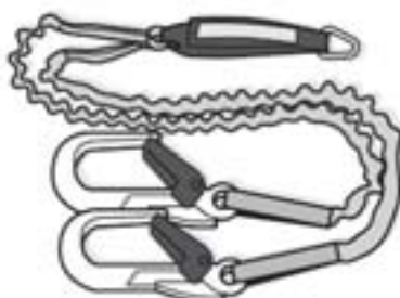
איור מס' 15 - דוגמה לרצועת ריתום כפולה למעבר

3. אין לעבור מסולם נשען למשטח גבוה יותר ללא הבטחה נוספת כנגד נפילה, כגון: קישור נוסף לרתמות, או משטח - מעבר יציב נוסף (ראה איור מס' 15).