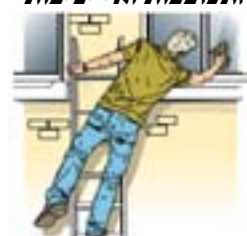
איור מס' 10 עבודה לא נכונה התכופפות ואי יציבות