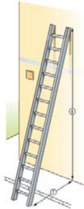
איור מס' 7 העמדה נכונה של הסולם ביחס 1:4

2. באם הסולם מצויד באמצעי/אביזרי נעילה ו/או הבטחה לסולם יש להבטח בהם את הסולם לפני השימוש.