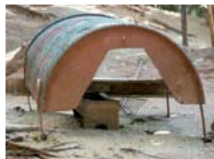
תמונות 7, 8, 9: בכל כלוב ולכל בעל חיים סידורי האוכל שלו. לאכול בנימוס ובהיגיינה, חיות יקרות...

אבל בצורה בה נעשה הדבר בגן החי של פתח תקוה ניתן לשמור על היגיינה וניקיון בצורה מתקבלת על הדעת. חלק מאזורי ההאכלה מקורים כדי לשמור על המזון מפני