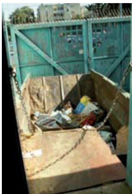
תמונה 13: מכולת האשפה של הגן - הרמפה במצב פתוח

במטבחון קטן מכינים את המזון לבעלי החי. עבודה זו כוללת בין השאר ניצול עודפי מזון ממקורות שונים בעיר, וכן בישול בשר עופות למאכל הקופים. ככלל, המזון מפוקח על ידי וטרנר ותזונאית, המקפידים על טיבו והתאמתו לצרכנים. פסולת ועודפים מושלכים למכולה המוצבת ליד פתח בקיר המבנה (תמונה 13). הפתח כולל רמפה מתרוממת, החסומה בצדיה בשרשרות ההרמה שלה. בשעה שאין צורך ברמפה היא מורמת וחוסמת את הפתח. מעת לעת מפנים את המכולה למיצבור האשפה העירוני. ■