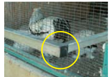
תמונה 1: גדר מפרופיל מתכת סביב הכלוב המרושת. המבקר אינו יכול להתקרב יותר על המידה לכלוב, ובנוסף אינו יכול להחדיר לחלל הפרופיל של הגדר ידיים וחפצים. בטיחות מירבית הן לחיה והן למבקר

כאלה שעלולים לנקר את הידיים המושטות אליהם לליטוף תמים. הפתרון שנמצא לסיכון זה הוא טיפוח הצמחייה שמסביב לאגם, המיתוספת לגדר מתכת המקיפה את כל המתחם כמו גם שביל להולכי רגל - וכל אלה יוצרים מרחק בטיחות נאות מבלי לכער את המקום (ראה תמונה פותחת בעמוד קודם). בנוסף, השבילים ברחבי הגן סלולים ופנויים מכל מכשול. לאחרונה שופצה הרחבה בכניסה. מהמורות שנוצרו שם בגלל התרוממות שורשי העצים יושרו וזו