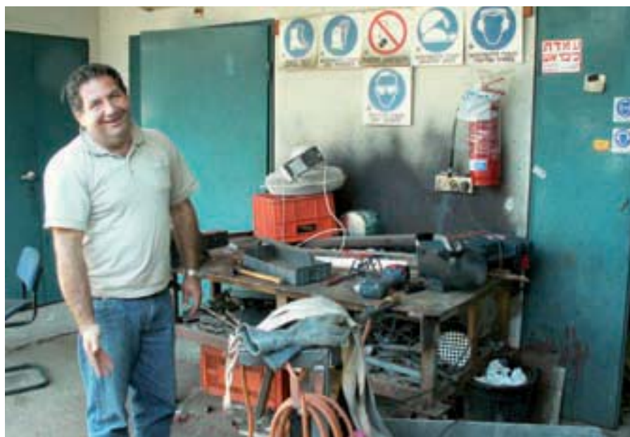
תמונה 10: המסגר נחום במסגריה: חובה לנעול, להרכיב, להשתמש. העיקר הבטיחות

אבל בצורה בה נעשה הדבר בגן החי של פתח תקוה ניתן לשמור על היגיינה וניקיון בצורה מתקבלת על הדעת. חלק מאזורי ההאכלה מקורים כדי לשמור על המזון מפני