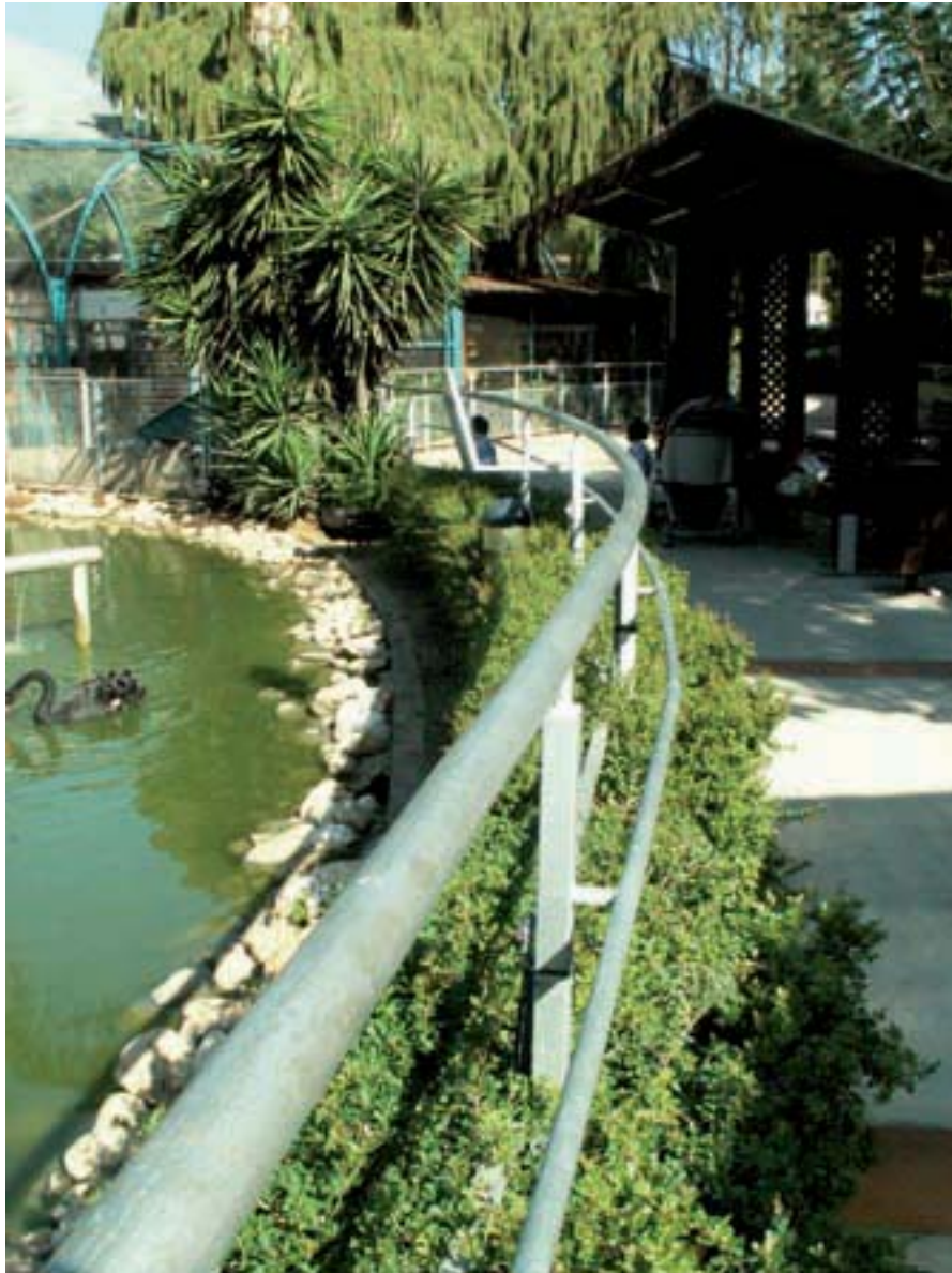
גדר מתכת, צמחייה מטופחת ושביל להולכי רגל - כל אלה מרחיקים את המבקרים מבעלי הכנף שבאגם. בתמונה: ברבור שחור

מי לא אוהב לטייל בגן חיות? כולנו, מילדות, וכעת אנו מגיעים לשם עם ילדינו ונכדינו, המושכים אותנו לעולם הקסום ההוא. אגן חיות, אגן חיי, 'פינת חיי' - כולם יש בעלי חיים, כולם מרגשים, מסקרנים, לעתים מותר לראותם בלבד, במקרים אחרים מותר גם ללטף ולהחזיק. בפתח תקווה, ממש בלב העיר, מצוי גן החי העירוני, והוא מטופח ומטופל להפליא. באנו לבקר, ליהנות, וגם לראות איך מאורגן שם כל מערך הבטיחות. התרשמנו