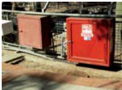
תמונה 12: שני ארגזים. מימין ארגז ובו ציוד תקני לכיבוי אש, ולצדו ארגז ובו צינור נגלל לשימושים אחרים