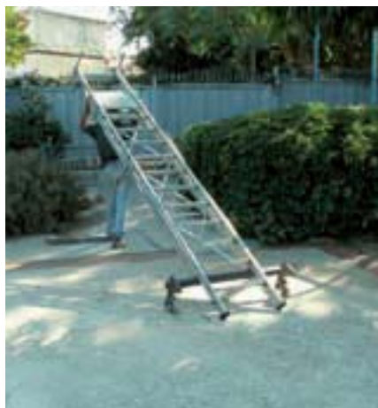
תמונה 11: הסעת הסולם בקלות ובנוחות